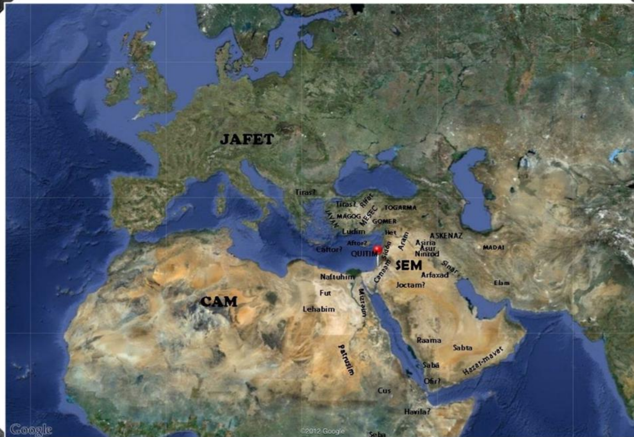
TABLA DE LAS NACIONES GÉNESIS 10